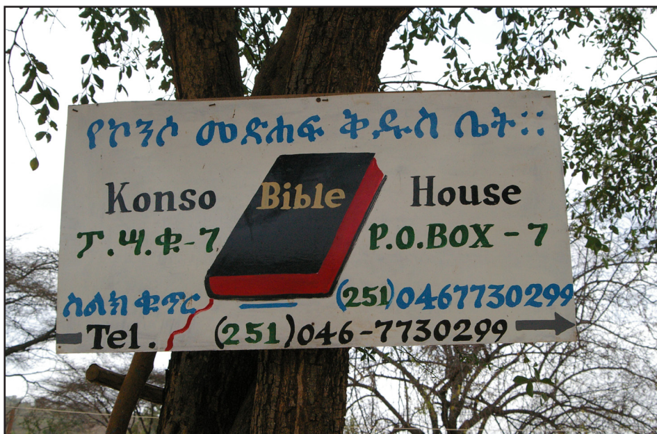
Á kristniboðsstöðinni í Konso var byggt Biblíuhús fyrir nokkrum árum