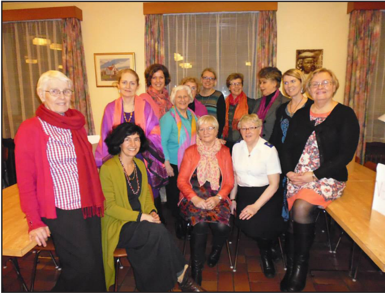
Landsnefnd um alþjóðlegan bænadag kvenna í Safnaðarheimili Landakotskirkju 6. mars 2015.