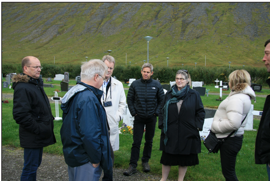
Kirkjugarðaráð á ferð um Vestfirði