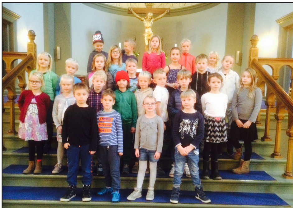
Heimsókn Íslenskuskólans í Skt. Pálskirkju