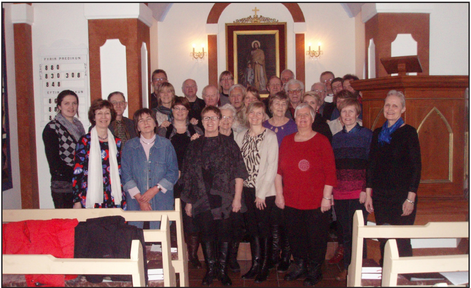
Kirkjukórar í Norður Þingeyjarsýslu í Snartastaðakirkju 1. mars 2015

gaf bókina út. Umsjón útgáfu og kynning var í mínum höndum og var nótnabókin boðin kirkjukórum á sérstöku verði í forsölu. Þannig var hægt að standa straum af prentkostnaði en bókin mun seljast um ókomin ár og fagnaðarefni þegar lestur Passíusálmanna eykst ár frá ári að eiga hin gömlu íslensku lög í smekklefum kórbúningi.