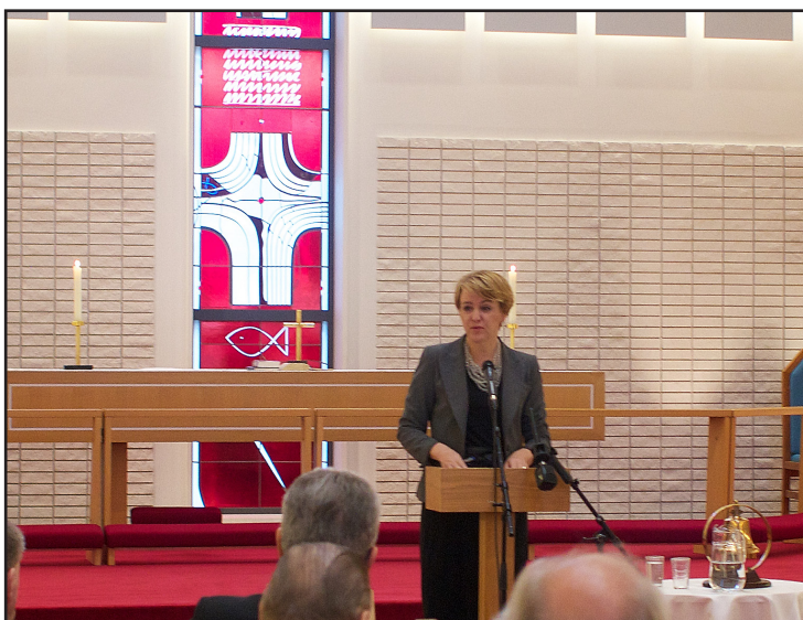
Hanna Birna Kristjánsdóttir í ræðustól

að ég teldi rétt að breyta fyrirkomulaginu er varðaði gjaldskrá fyrir aukaverk presta, svo dæmi sé tekið, enda tel ég að ráðherra eigi ekki að ákveða slíka gjaldskrá heldur kirkjan sjálf. Nú er unnið að þessu innan ráðuneytisins í samstarfi við stjórn Prestafélag Íslands og ég vonast til að geta nú í vetur lagt fram frumvarp þar sem núgildandi lög eru komin til ára sinna, en þau eru frá árinu 1931, verði afnumin og verkefnið falið kirkjuþingi. Ég mun einnig nú í vetur flytja frumvarp til breytinga á lögum um stöðu, stjórn og starfshætti Þjóðkirkjunnar; þetta kemur til að beiðni kirkjuráðs og með vísan til samþykka síðasta kirkjuþings líkt og þið þekkið. En eins og forsetinn ykkar kom inn á aðan þá hefur endurskoðun þeirra laga staðið yfir í nokkurn tíma á ykkar vettvangi en ekki hlotið endanlega afgreiðslu, enda heildarendurskoðun þessa máls umfangsmikil og stefnumarkandi. Ég geri fastlega ráð fyrir að sú vinna haldi áfram en með frumvarpi þessu og því sem þar kemur fram, eru hins vegar lagðar til ákveðnar breytingar á lögnum sem miða að því að veita kirkjuþingi auknar heimildir til að setja starfsreglur um ýmis atriði í stjórnskipan kirkjunnar sem áður hafa verið bundin í lög svo og að auka fjárstjórnunarvald þess en það er eitthvað sem talið hefur verið afar mikilvægt. Ég vona að af framlagningu þess geti orðið innan fárra vikna og um það takist ágæt sátt á hinu háa Alþingi.