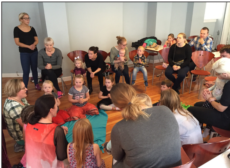
Sunnudagaskóli í Jónshúsi í Kaupmannahöfn