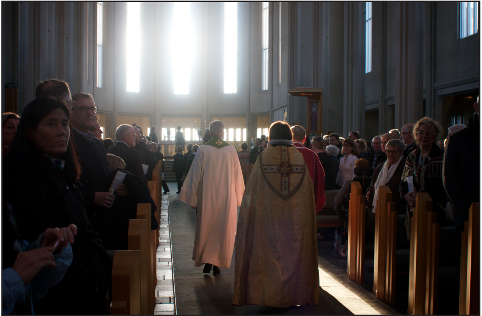
Frá messu í Hallgrímskirkju við upphaf kirkjubings 2014

fjárhagsstaða hinna 270 sókna landsins komin niður fyrir þölmörk og Þjóðkirkjan á í vanda við að standa við þjónustuskyldur sínar við þjóðina.