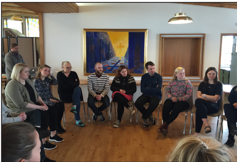
Frá kirkjuþingi unga fólksins

einum aðila úr hverju prófastsdæmi fyrir sig. Nefndin sér um ofangreinda hluti ásamt því að móta nýja umhverfisstefnu og taka þá grænfánann sem fyrirmynd og standi að fræðslu um umhverfismál í öllum prófastdæmum.