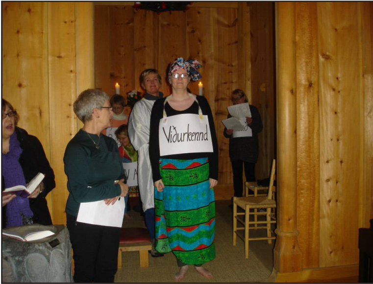
Konur í Vestmannaeyjum flytja dagskrá frá Bahamaeyjum 6. mars 2015.

og því hlýtur ríkisstjórn Íslands að vera óheimilt að skerða þau“ og skorað á „ráðherra að sjá til þess að samþykkt ríkisstjórnarinnar [um að leiðrétta skerðingu fyrri ára] verði fylgt eftir og að endurskoðuð verði sú skerðing sem fjárlög boða.“ Einnig voru útvarpsstjóra og dagskrárstjóra Rásar 1 send andmæli nefndarinnar vegna breytinga á morgunbænum og Orði kvöldsins (september 2014).