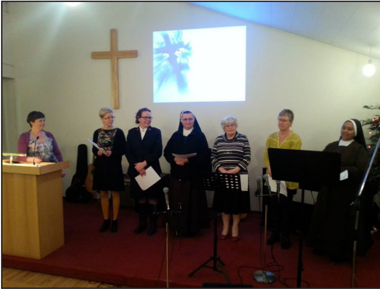
Samkirkjulegur hópur kvenna á Akureyri stóð að Alþjóðabænadegi kvenna 2015.

fulltrúum þökkuð mikilvæg og gefandi störf í þágu samkirkjulegra málefna á Íslandi um leið og nýjum fulltrúum er fagnað.