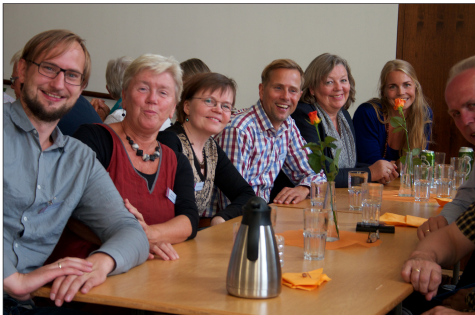
Þátttakendur á norrænu djáknaráðstefnunni í Keflavík

Eurodiaconia sagði frá hvernig þessi samtök geta stutt kærleikspjónustu Norrænu kirknanna. Þá var hópastarfar þar sem kynnt var hjálparstarf og barátta gegn fátækt; Þjónandi forysta; kyrðarbæna og notkun internetsins í starfi meðal aldraðra. Fulltrúar hinna kirknanna kynntu verkefni sem reynst hafa vel hjá þeim. Góð viðbrögð voru við dagskránni sem sýnir að við höfum miklu að miðla. Mikilvægur þáttur í svona ráðstefnu er að efla þátttakendur og skapa tengsl þeirra á milli.