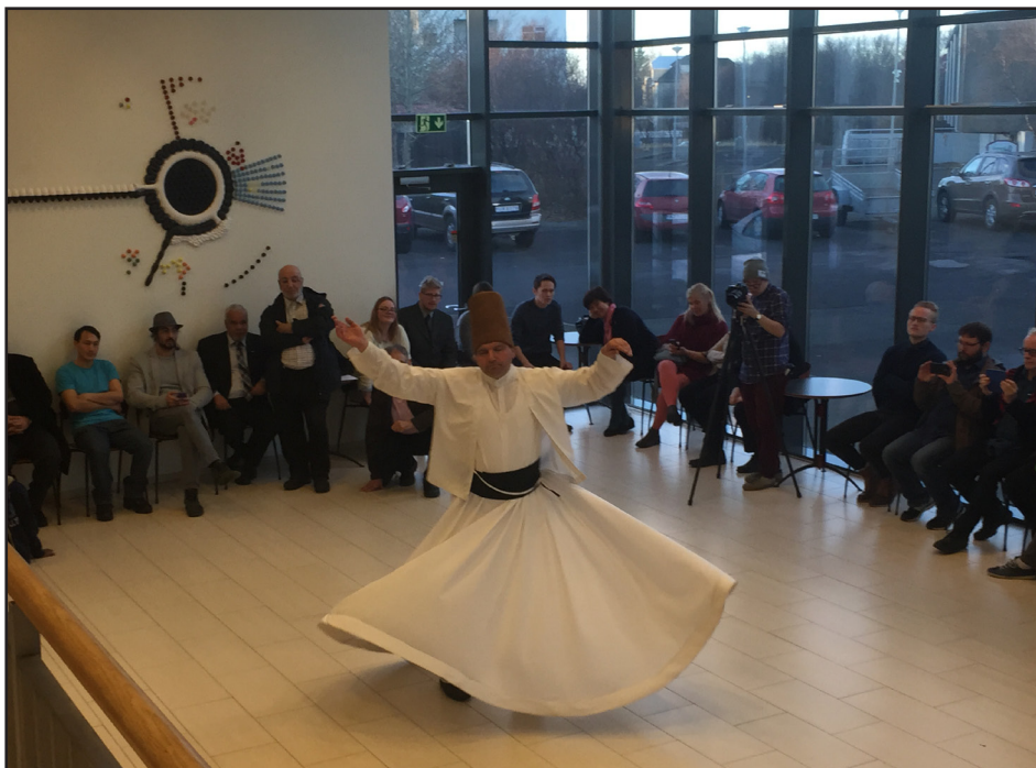
Sema-dans dansaður á Ashura hátíðinni sem haldin var í Nes Kirkju

mikilvægt hlutverk og eitt af markmiðum prests innflytjenda.