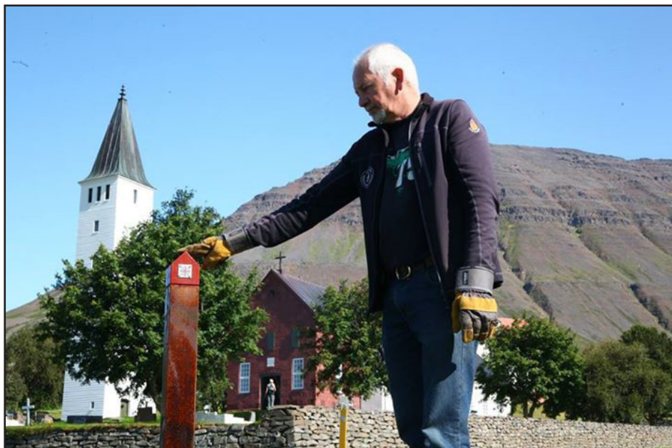
Gönguleiðir merktar með pilgrímastaurum

Aðventuhugleiðingu hafði ég hins vegar í Skagaseli þann 6. desember, en það var sameiginleg aðventusamkoma Ketu- og Hvammssókna. Þann 14. júní 2015 predikaði ég þegar haldið var upp á 150 ára afmæli Grenjaðarstaðarkirkju.