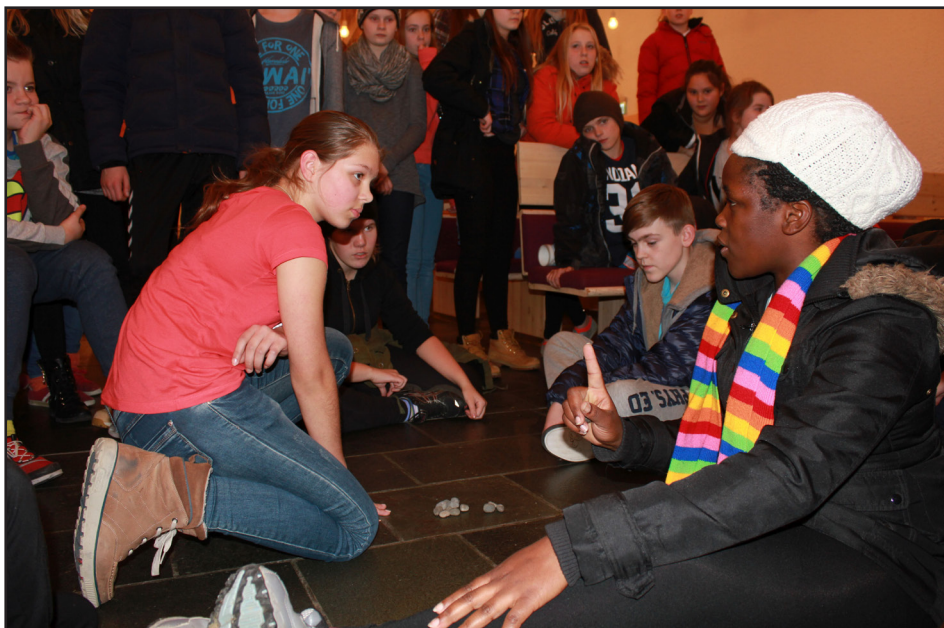
Irene frá Úganda fræðir fermingarbörn í Breiðholtsskirkju um lífið í Úganda.