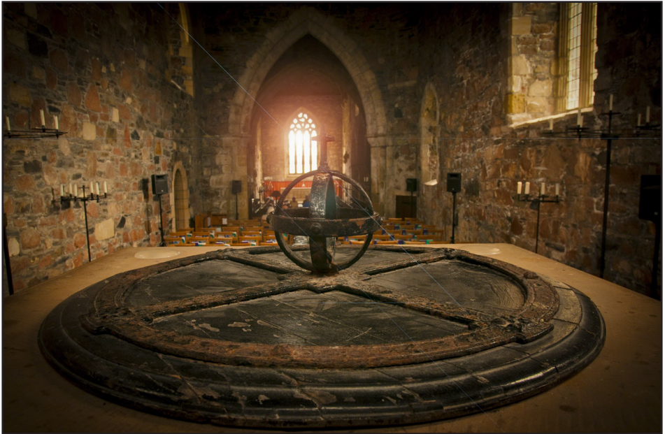
Myndin sýnir listaverk fremst í skipi klausturkirkjunnar á eyjunni Iona á Suðureyjum. Heilagur Kolumkilli reisti þar klaustur 563. Kristnir menn er komu sem landnámsmenn til Íslands frá keltneskum menningarsvæðum Bretlandseyja munu hafa litið á hann sem dýrling sinn og vildarmann.

fyrirgreiðslu, miðaði að því að kanna hug íslensks kirkjufólks og ráðamanna til þess að hér á landi yrði haldin ráðstefna í samstarfi við Heimsráð kirkna, WCC, um réttlátan frið og nauðsyn umhverfisverndar. Með því væri fylgt meginstefnumörkun alsherjarpings WCC 2013 í Búsan í Suður-Kóreu. Þeir töldu Ísland vera kjörinn vettvang slíks ráðstefnuhalds vegna hnattlegu, sögu sinnar, fegurðar og friðarmenningar. Bæði í fyrirlestum sínum í Háskóla Íslands og merkum kynningarfundum í Langholtskirkju, sem forsvarsmenn kristni og fulltrúar ráðamanna sóttu, kynntu þeir þessi sjónarmið og fengu góðar undirtektir.