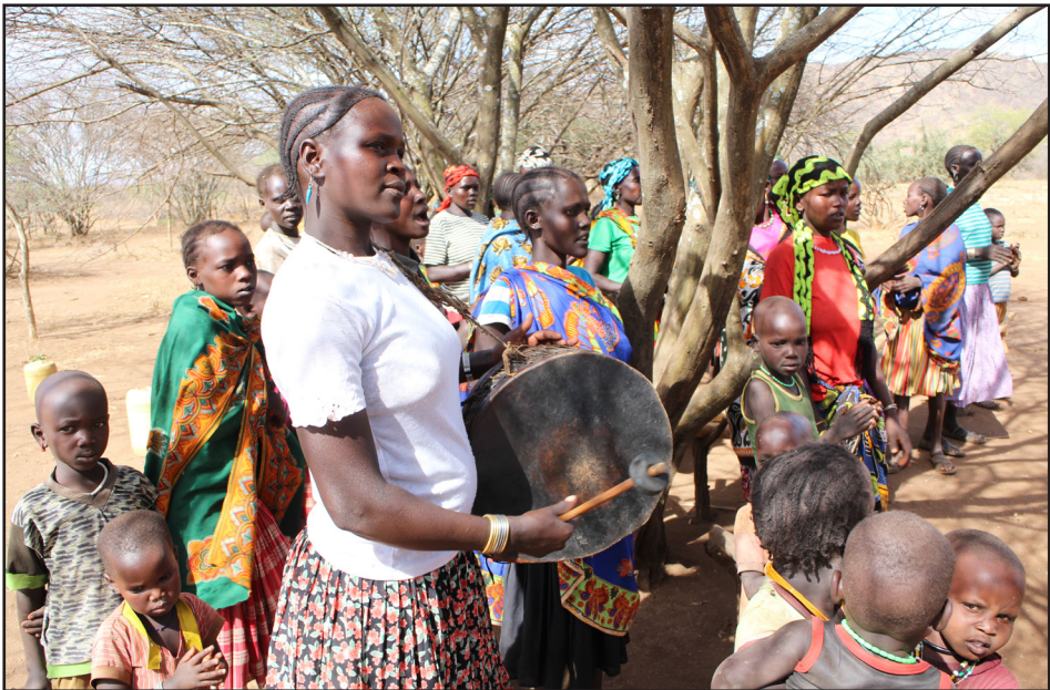
„Organistinn“ þ.e. trommuleikarinn í Kalodeke á landamærum Keníu og Úganda