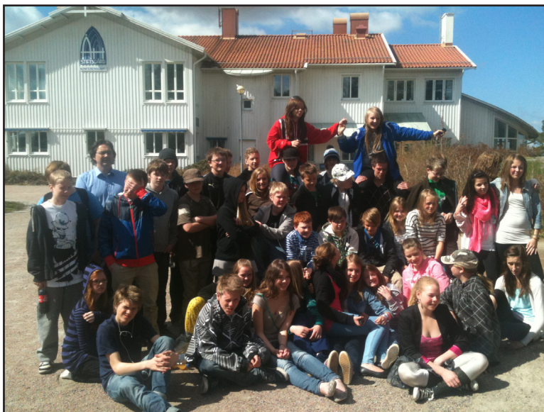
Frá fermingarmóti á ÁH stiftgård, 34 unglingar voru í fermingarfræðslu í Svíþjóð og Danmörku