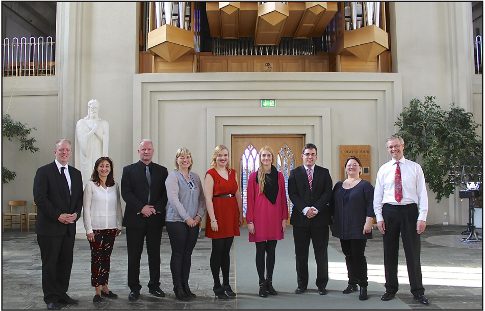
Frá skólaslitum Tónskólans í Hallgrímskirkju 22. maí 2015

Föstudaginn 15. maí voru vortónleikar Tónskólans í Langholtskirkju þar sem fram komu nemendur skólans í orgelleik.