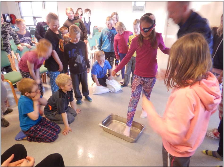
Sumarbúðabörn að leik

allt sumar á Fljótsdalshéraði að hann hengi þurr í fjóra daga samfleytt og því fór sem fór. Til stendur að bæta úr þessu strax með vorinu, um leið og veður leyfir.