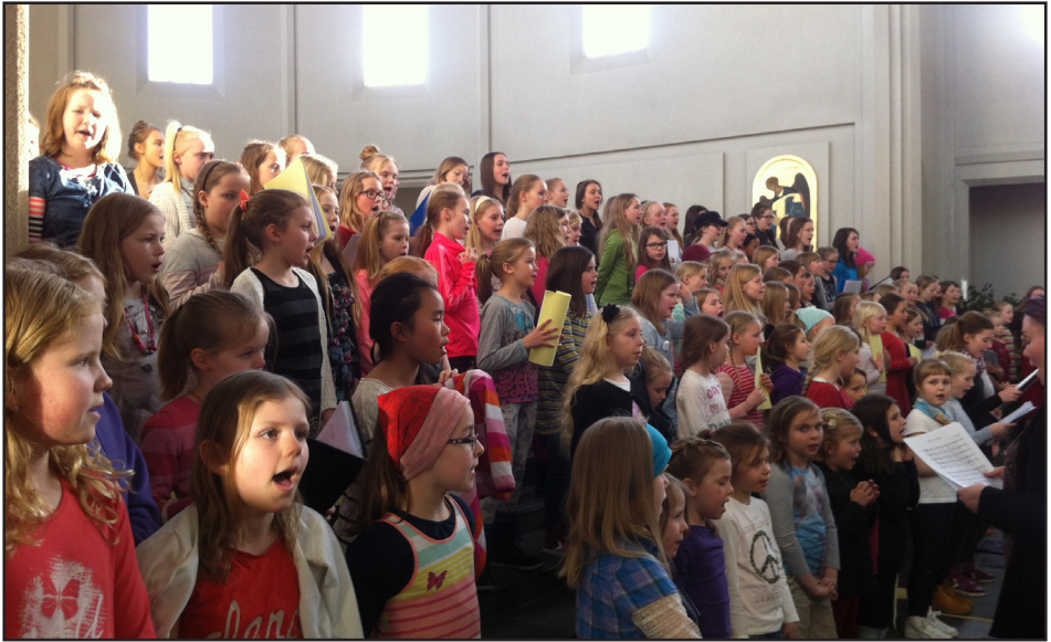
Syngjandi börn á Söngvahátíð barnanna á skírdag 2015 í Hallgrímskirkju