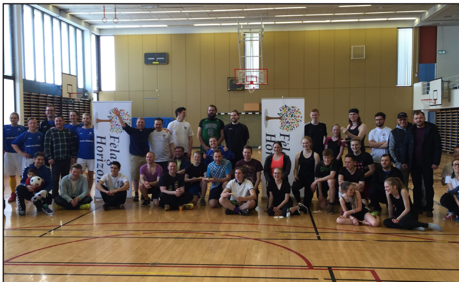
Frá brenniboltamóti Horizon

Hins vegar stefnir prestur innflytjenda að halda mánaðarlega messu á ensku í Breiðholtskirkju á næsta starfsári og ef það gengur upp, mun staðan verða mun betri.