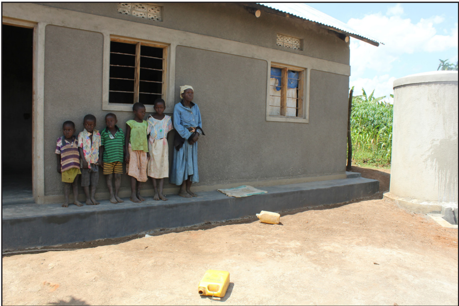
Amma í Úganda sem sér um sjö barnabörn við nýtt hús með vatnstanki.

hreinlætis var gætt í alla staði. Fjárhagsáætlun síðasta árs var 22.6 milljónir króna, þar af leggur Utanríkisráðuneytið fram 70% af kostnaði.