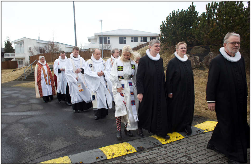
Prósessía á Prestastefnu 2015

útlendingastofnun. Ég hefur falið Þjóðmálanefnd að vinna að málinu í samráði við ofangreinda aðila, ásamt presti innflytjenda og hugmyndasmið tillögunnar.