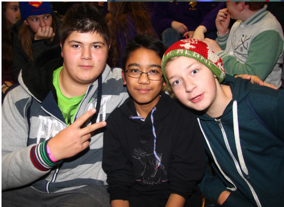
Myndir frá Landsmóti ÆSKÞ á Hvammstanga í október 2014