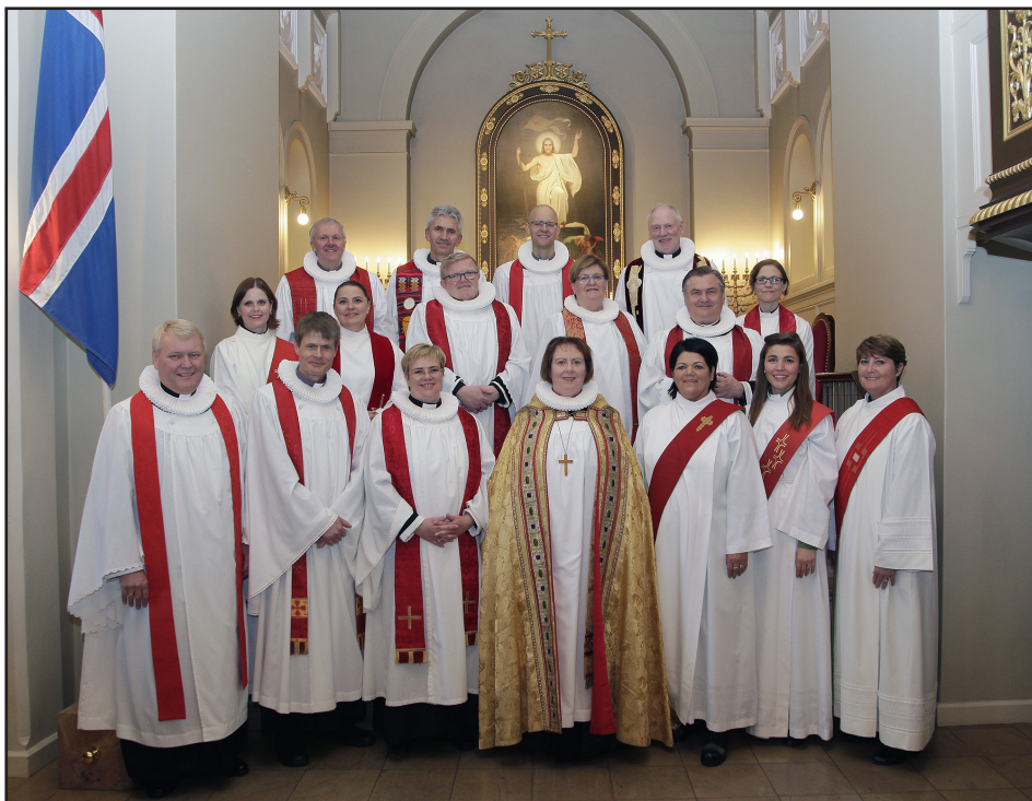
Prests- og djáknávígsla í Dómkirkjunn í Reykjavík 14. september 2014.