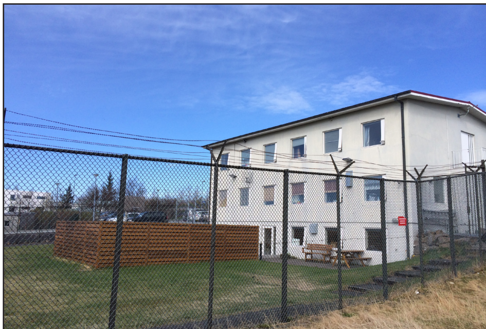
Kópavogsfangelsinu var lokað 2015